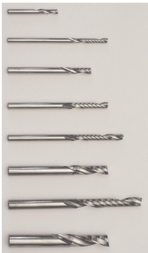
F 113 0300